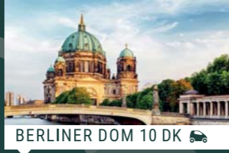
BERLINER DOM 10 DK