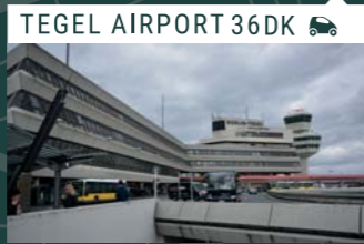
TEGEL AIRPORT 36DK