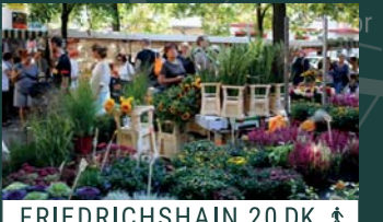
FRIEDRICHSHAIN 20 DK